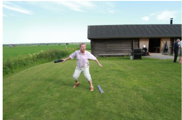
Uuden presidentin taidonnäyte – toivottavasti kausi 2011-2012 on yhtä lennokas!