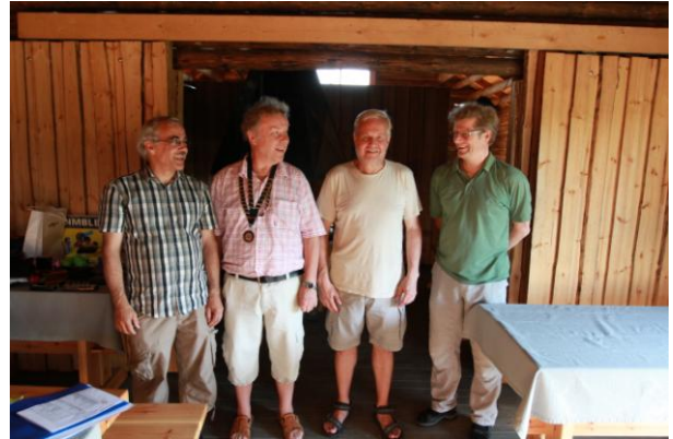
Vaihto tehty ja kaikki näyttävät helpottuneilta(?)